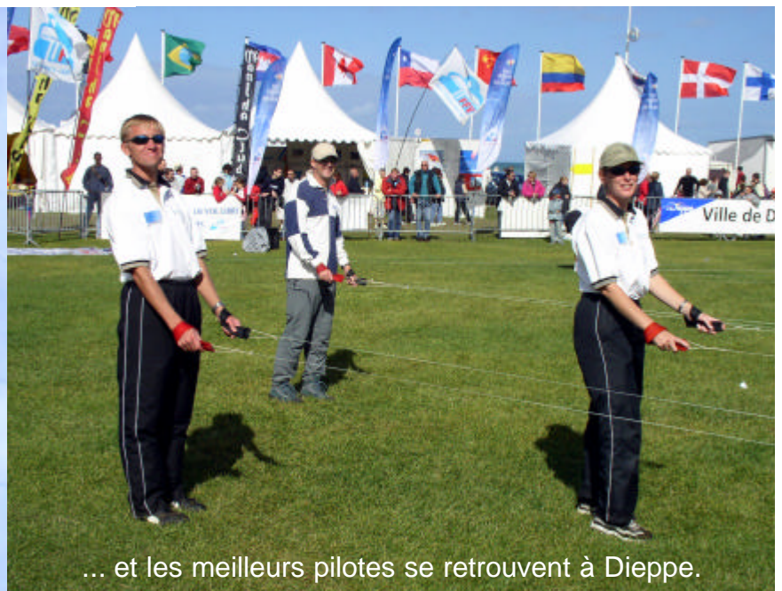
... et les meilleurs pilotes se retrouvent à Dieppe.