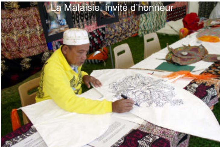
La Malaisie, invité d'honneur