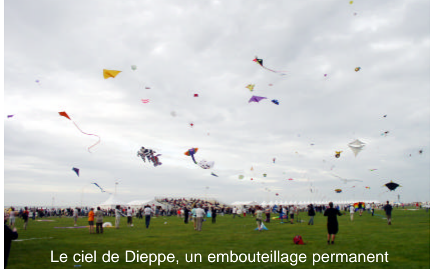
Le ciel de Dieppe, un embouteillage permanent

Si je conseille à tous, y compris les béotiens en la matière, d'aller une fois dans leur vie assister à cette fête,